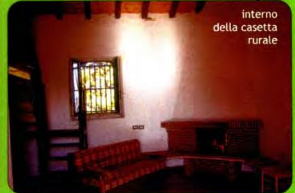
interno della casetta rurale